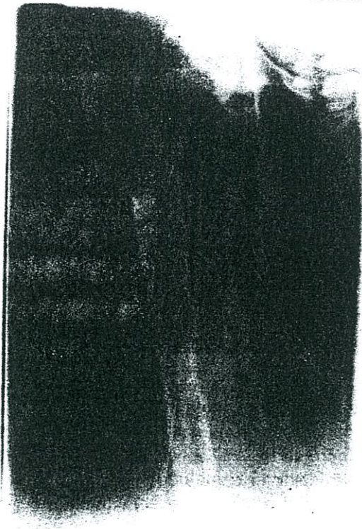
Resim 2: Tx sonrası graft fonksiyonu normal olan hastamızda femurda oluşmuş Brown tümörü