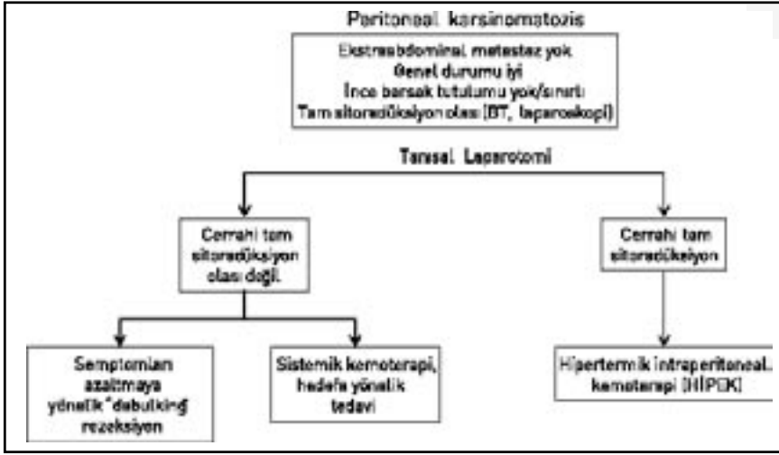
Şekil 9: Kolorektal kansere bağlı peritoneal karsinomatozis için tanı ve tedavi algoritması

akım hızı genellikle 600-1000 ml/dk'ya ayarlanır ve 90 dakika boyunca sirküle edilir. Karın içi ısının 42.5 °C'a ulaşması için sıvı giriş ısısı yaklaşık 44 °C'a çıkarılır. Doksan dakika sonunda perfüzyon sıvısı boşaltılır ve karın hemostaz açısından kontrol edilir. Gerekli barsak anastomozları ve/veya stomalar oluşturulur.